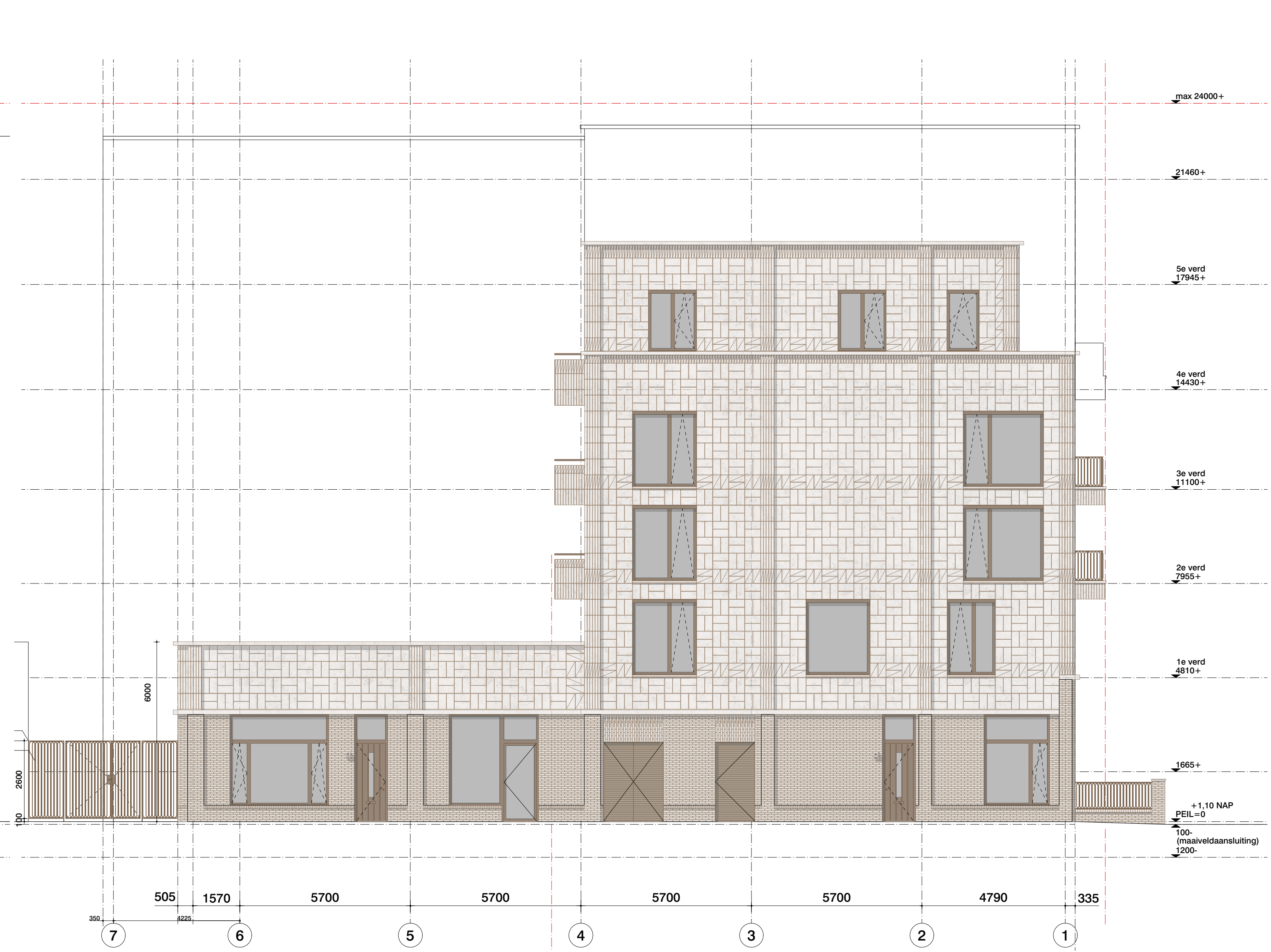
033 Zuid-Oost gevel blok 1

Voor afwerkingen en materialen zie 2410 DO 002 Kleur- en materialenstaat Standaard tegelmaten tenzij anders aangegeven (passtenen met arcering):