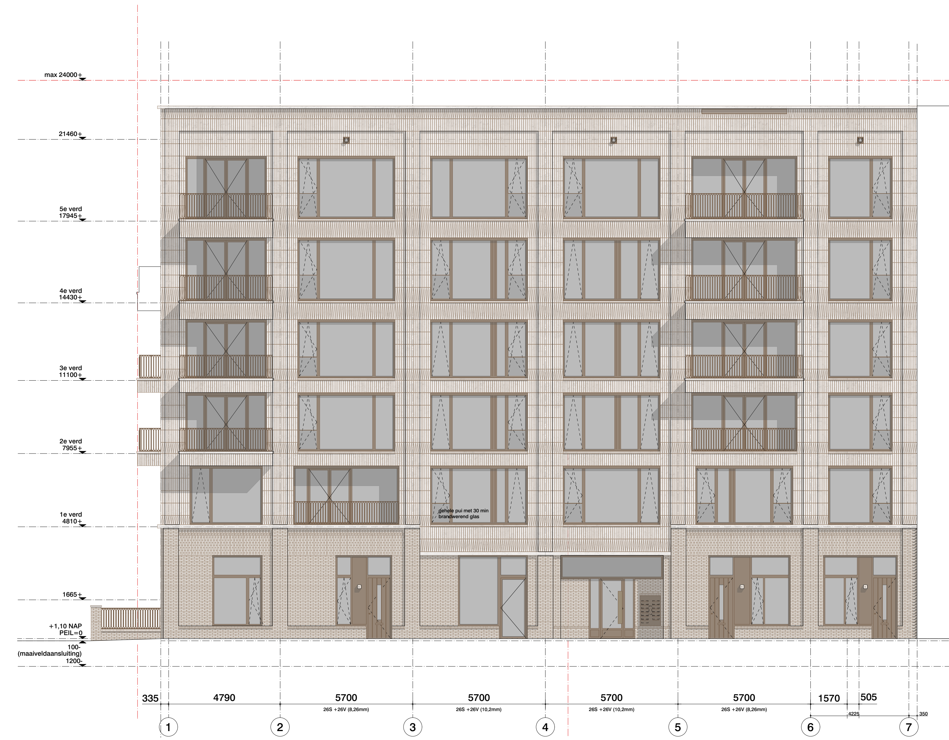
032 Noord-West gevel blok 4